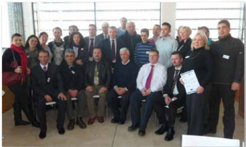
сл.5 Учеснициите и домаќините на студијската посета во Омаг, Северна Ирска

„Го идентификувавме предизвикот на испорака на услугите во поделено општество. Испораката на тие услуги на демократски начин, открива поддршка на мнозинството и малцинството и исто така открива институционални, административни и финансиски разлики. Генералниот впечаток е дека непристрасноста е најважниот стандард и основно барање на граѓаните“, вели Џо Леонард, претседавач на советот на Слиго. Според него фрустрациите најчесто растат заради финансиски ограничувања и се артикулираат како етничка доминација. „Политичката корупција се чини дека е проблем во донесувањето на одлуките и во процесот на финансиска алокација“, додава тој.