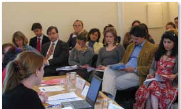
сл.13 „Алката што недостасува“ беше промовирана во Брисел

БЦСДН ја објави публикацијата „Алката што недостасува? Развој и функционирање на граѓанскиот дијалог на Западен Балкан“, стратешки документ кој е продолжение на напорите на БЦСДН да им понуди и на локалните и на меѓународните засегнати страни, особено на институциите на ЕУ, анализа и препораки за развој на граѓанското општество на Балканот со фокус на неговата улога во процесот на пристапување кон ЕУ.