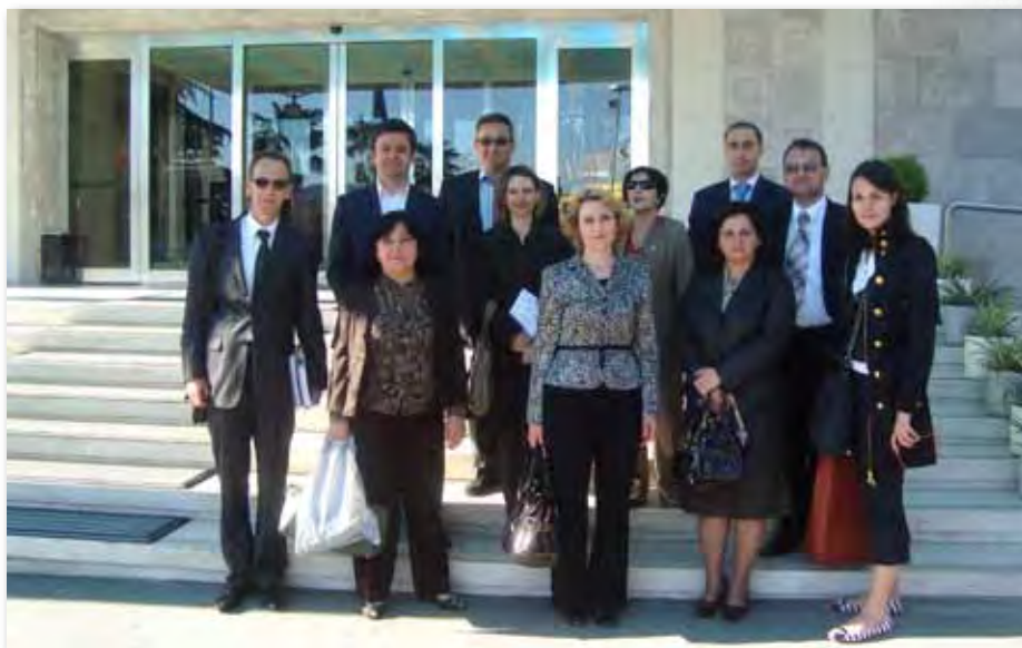
сл.9 Учесниците на студиската посета во Албанија

Релевантните државни институции и граѓански организации на учесниците им ги претставија правната регулатива и искуствата при имплементацијата на партиципативното буџетирање на национално и локално ниво. Учесниците го посетија Здружението на општините на Албанија, Парламентот, а имаа средби и со претставници од парламентарната Комисија за економија и финансии. Во Министерството за финансии им беше претставен процесот на подготовка на буџетот и новиот пристап кон програмски буџетски процес. Дел од добрите