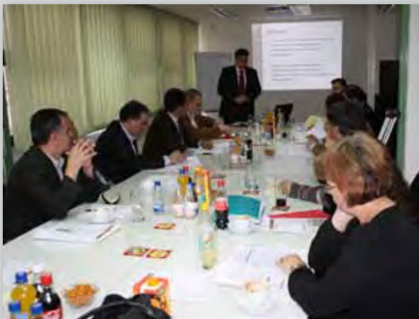
сл.16 Една од седниците на Советот на МЦМС