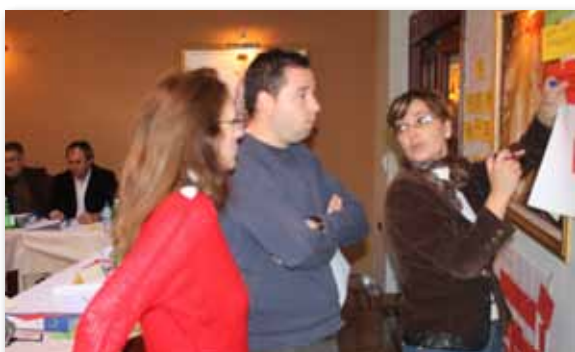
сл.8 На обуката за јавно - приватно партнерство присуствуваа 54 претставници од јавниот и приватниот сектор.

регион: Битола, Прилеп, Ресен, Крушево, Демир Хисар, Новаци, Могила, Долнени и Кривогаштани.