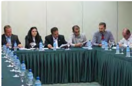
сл.14 Една од средбите на Националното координативно шело