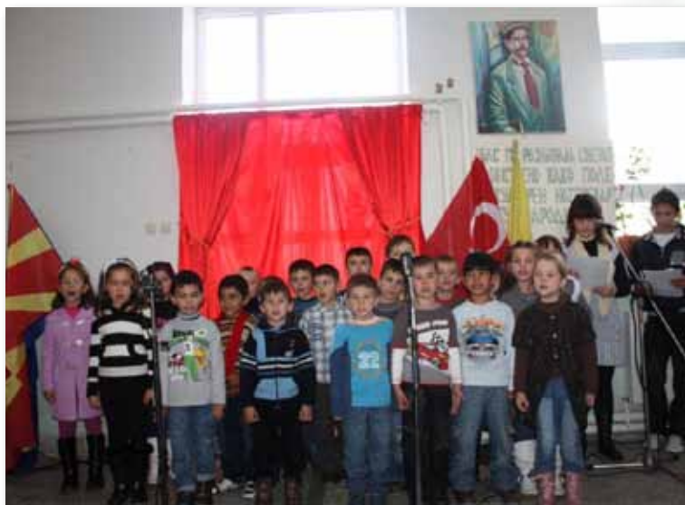
сл.1 Од програмата што наставниците и децата ја подготвија за нивните гости