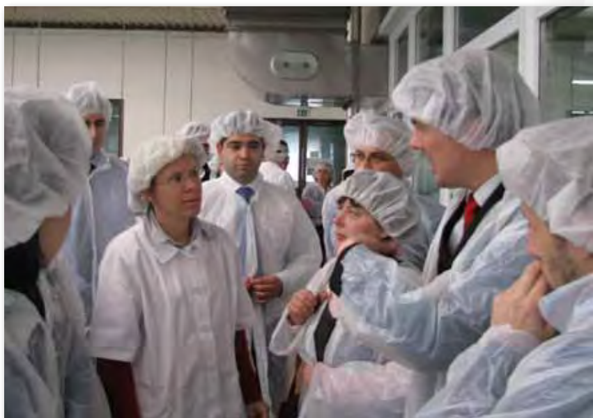
сл.4 Од посешта на млекарницата Целена при студиската посешта на Словенија

Реализирана е студиската посета на Словенија за ИПАРД за претставници на финансиски институции, а обезбедена е и финансиска поддршка за изработка на софтвер за оценка на микрокредити.