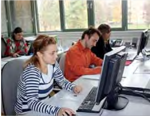
сл.15 Волонтерите во МЦМС можат да го видат работниот процес од внатре

За дел од волонтерите ова е прво посериозно искуство. Сепак, според нив, прилагодувањето не е тешко.