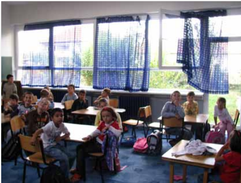
сл.2 Новише прозорци за подобро здравје на учениците и заштеда на енергијата

На крајот на октомври 2010 година, во ОУ „Браќа Миладиновци“, во Скопје, се одржа последната форумска сесија, во рамките на програмата Форуми во заедницата во општина Аеродром. Во периодот од октомври 2009 до април 2010 година се одржаа 7 форумски сесии, на кои во просек учествуваа по 120 учесници. Од предлог идеите, жителите на општината ги изгласаа проектите: реконструкција на прозорци и врати во основните училишта „Блаже Конески“, „Браќа Миладиновци“, „Гоце Делчев“ и градинката „Изворче“. Беа заменети вкупно 307 прозорци и врати што ќе овозможи поквалитетно одвивање на наставата и подобрување на енергетската ефикасност.