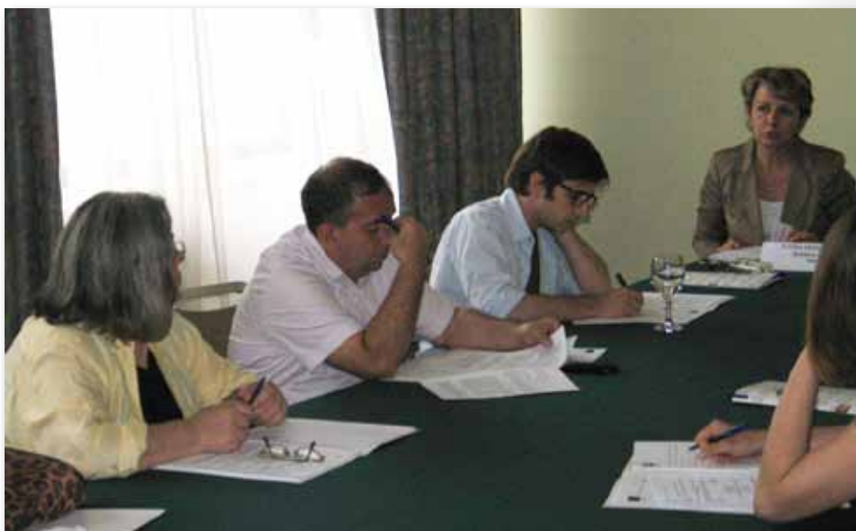
сл.3 Сојузот МБД беше многу активен во процесот на формулирање и носење на Законот

МЦМС активно учествуваше на седниците на собраниските комисии на кои се дискутираше предложениот Законот за спречување и заштита од дискриминација (ЗСЗД) и во рамките на Сојузот Македонија без дискриминација, предложи 33 амандмани, од кои половината беа прифатени. По донесувањето на ЗСЗД се организираа и работилници на Националното координативно тело за недискриминација, на кои се дискутираше за формирањето на Комисијата за заштита од дискриминација. Беше организирана и работилница „Предизвици за спроведувањето на Законот за спречување и заштита од дискриминација“.