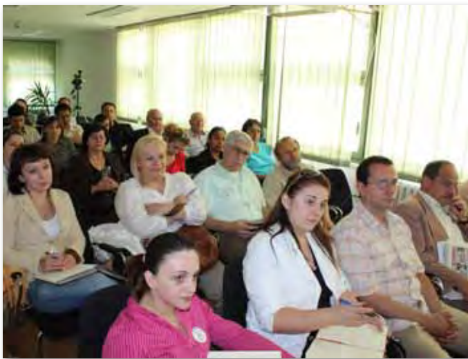
сл.11 Од информативниот настан за ЗЗФ во Скопје

Со цел, поголема информираност на граѓанските организации за новиот закон и новините, во мај и јуни 2010 година беа организирани пет информативни настани за ЗЗФ во Битола, Гостивар, Струмица, Велес и Скопје, на кои учествуваа 98 претставници од граѓанските организации.