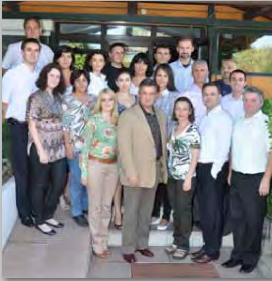
сл.17 Вработенише во МЦМС